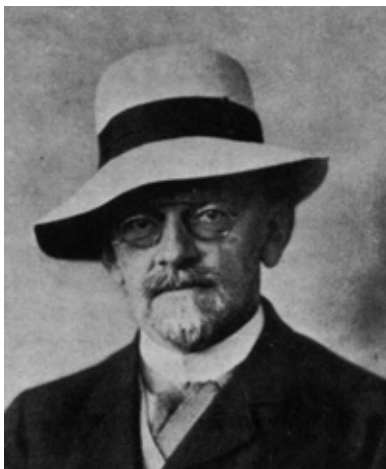
Figura 2. David Hilbert (1862-1943).

comportamiento asintótico de tal manera que cuando n \rightarrow \infty en C_nH_{2n+2} , J \rightarrow 2\pi . 9,10