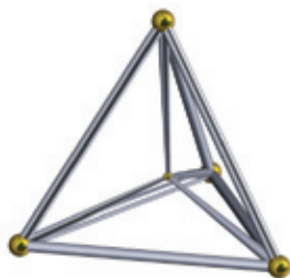
Figura 5. Una imagen bidimensional de una proyección tridimensional del pentácoron.