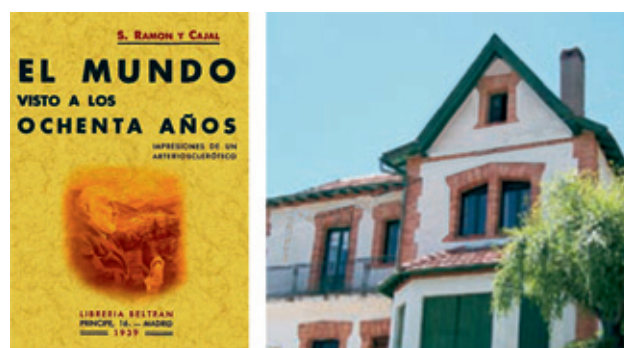
Figura 1. “Recuerdos” de Santiago Ramón y Cajal.

Para un químico este problema puede plantearse así: dado que es conocido que el único enlace que puede repetirse